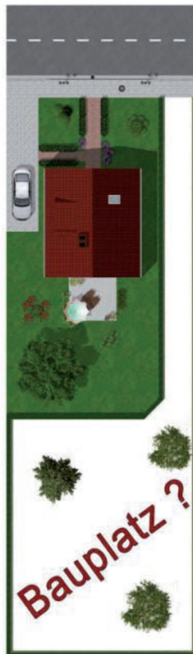
Pfeifenstielgrundstücke: bei der Teilung sind wichtige Punkte zu beachten

Ü brigens: bei einer Einigung sind alle unsere Leistungen, inkl. unserem Antragservice, für Sie als Verkäufer kostenfrei. Rufen Sie uns gerne an oder schreiben Sie uns, wenn Sie verkaufen möchten.