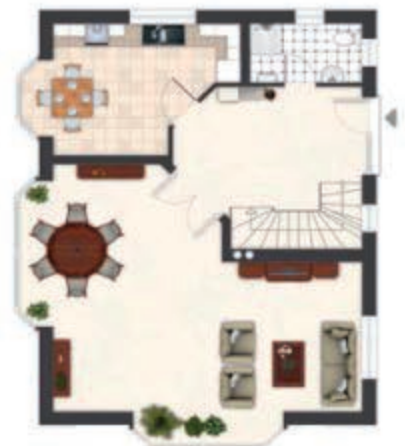
Optimal präsentiert: grafisch aufbereitete Grundrisse